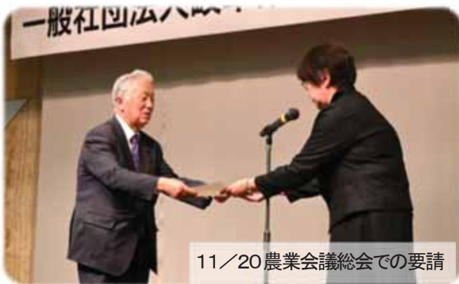
11/20 農業会議総会での要請

本ネットワークでは、この勢いのまま本年7月の35農業委員会の統一改選に向け、各委員会への女性登用要請や委員候補の推薦などを行い、女性割合30%を目指していきます。